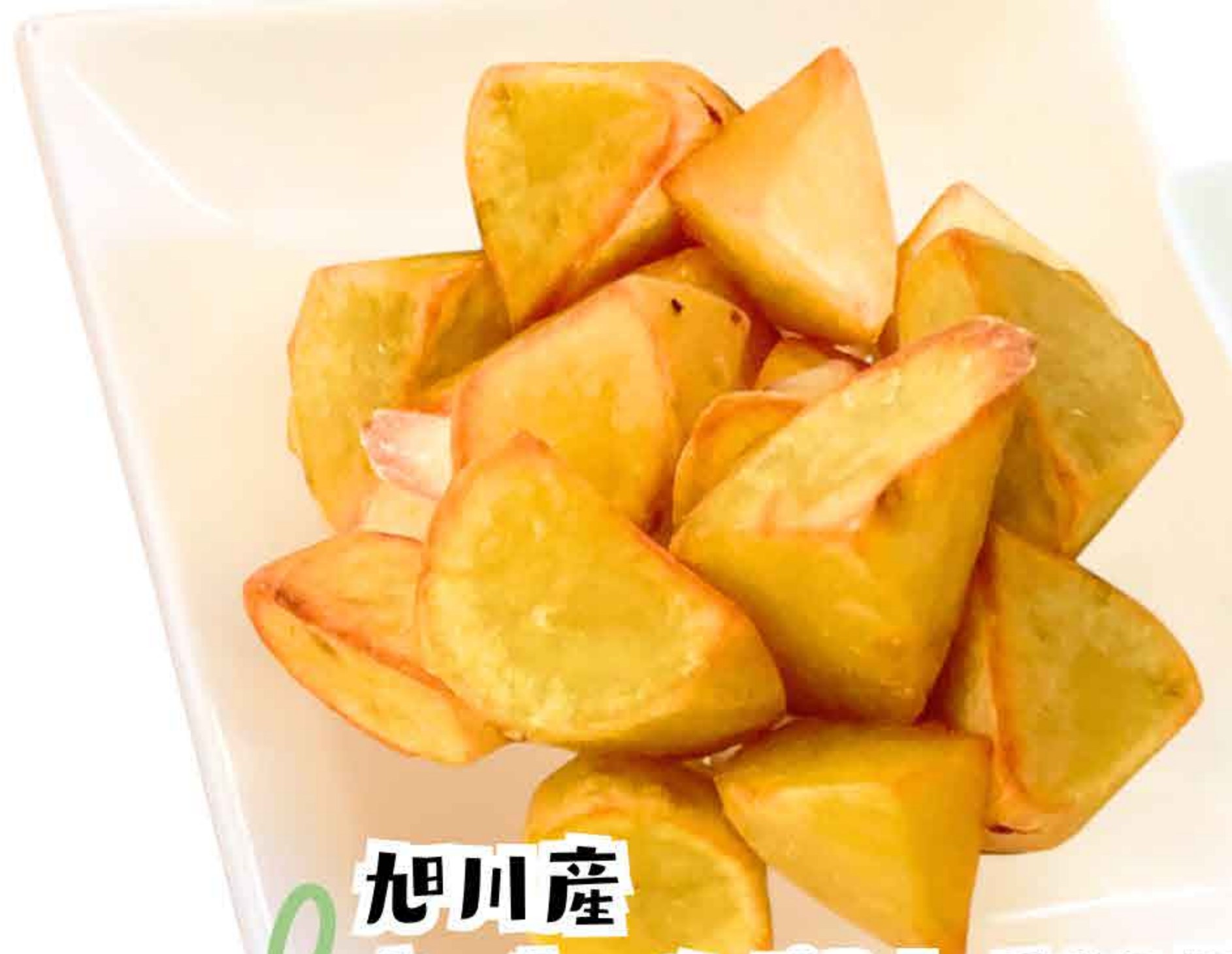
旭川産 さつまいもポテト 500円 Fried Sweet poteto