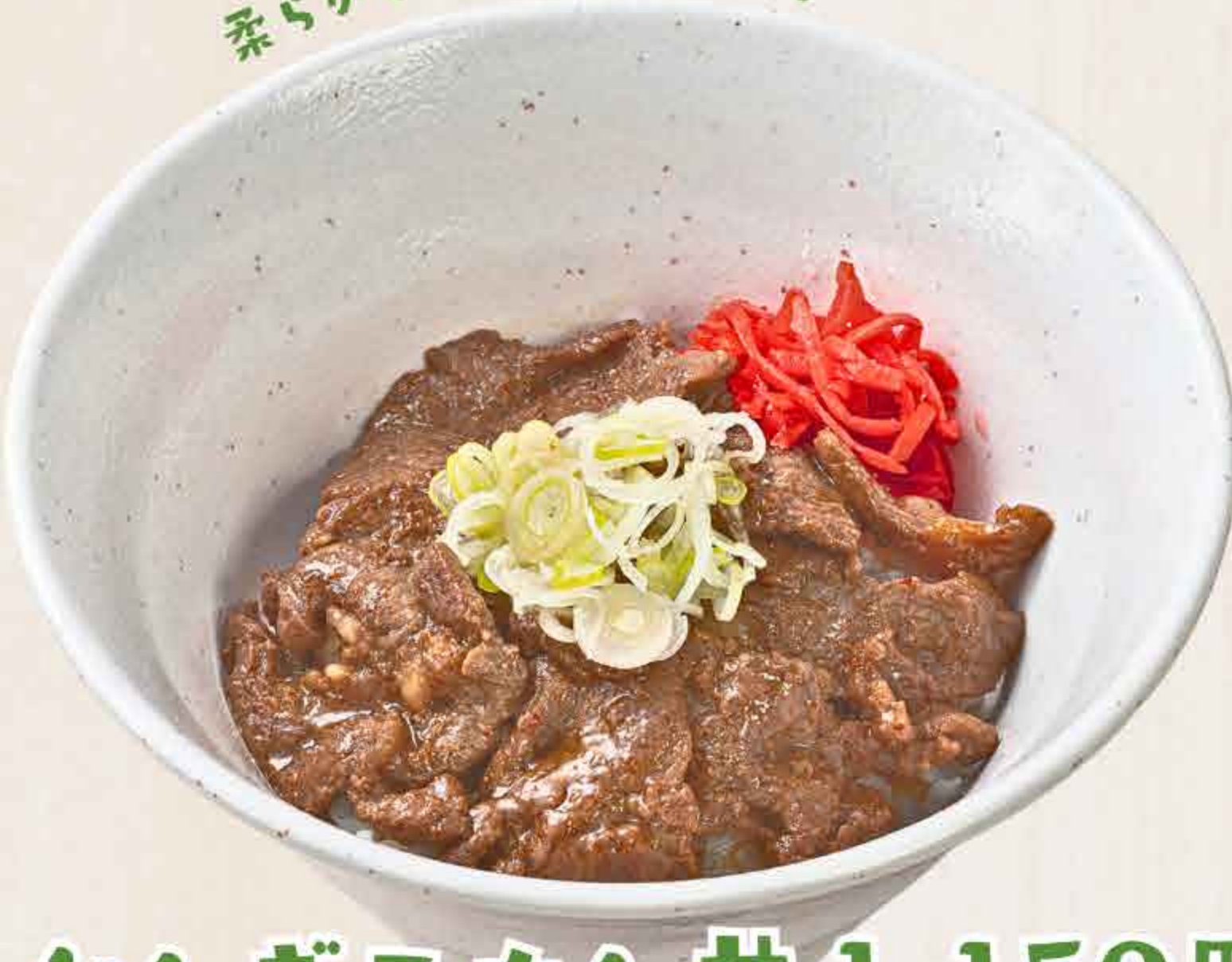
ジンギスカン丼 1,150円 Genghis Khan Rice Bowl