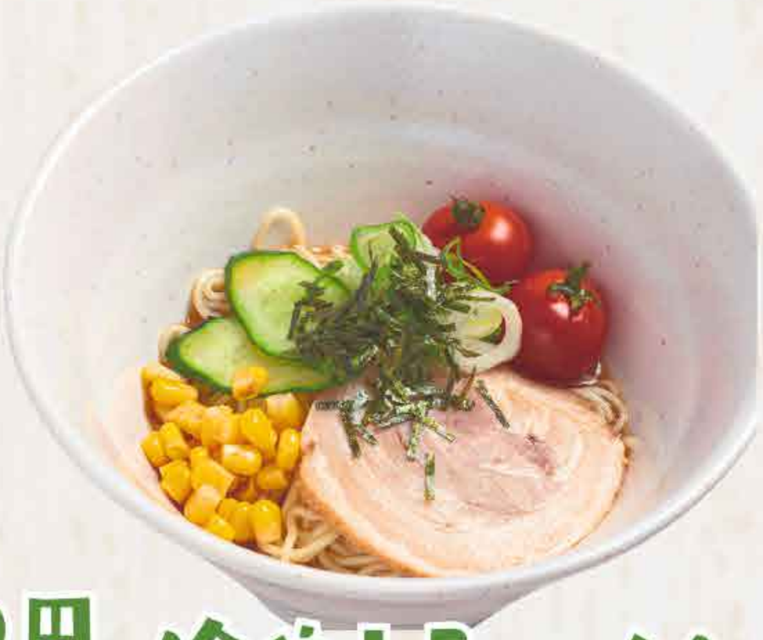
冷やしラーメン 1,100円 Cold Ramen