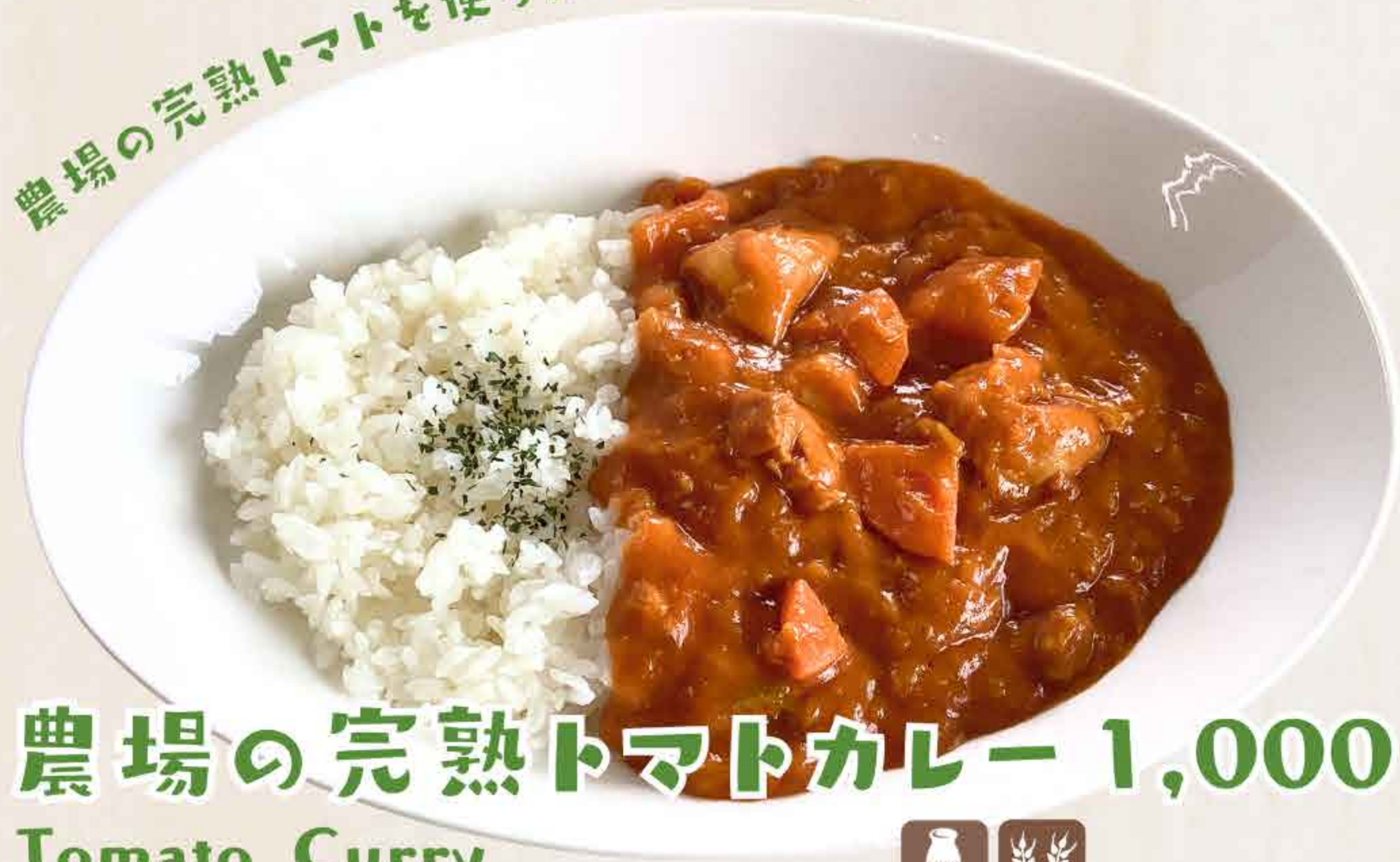
農場の完熟トマトカレー 1,000円 Tomato Curry