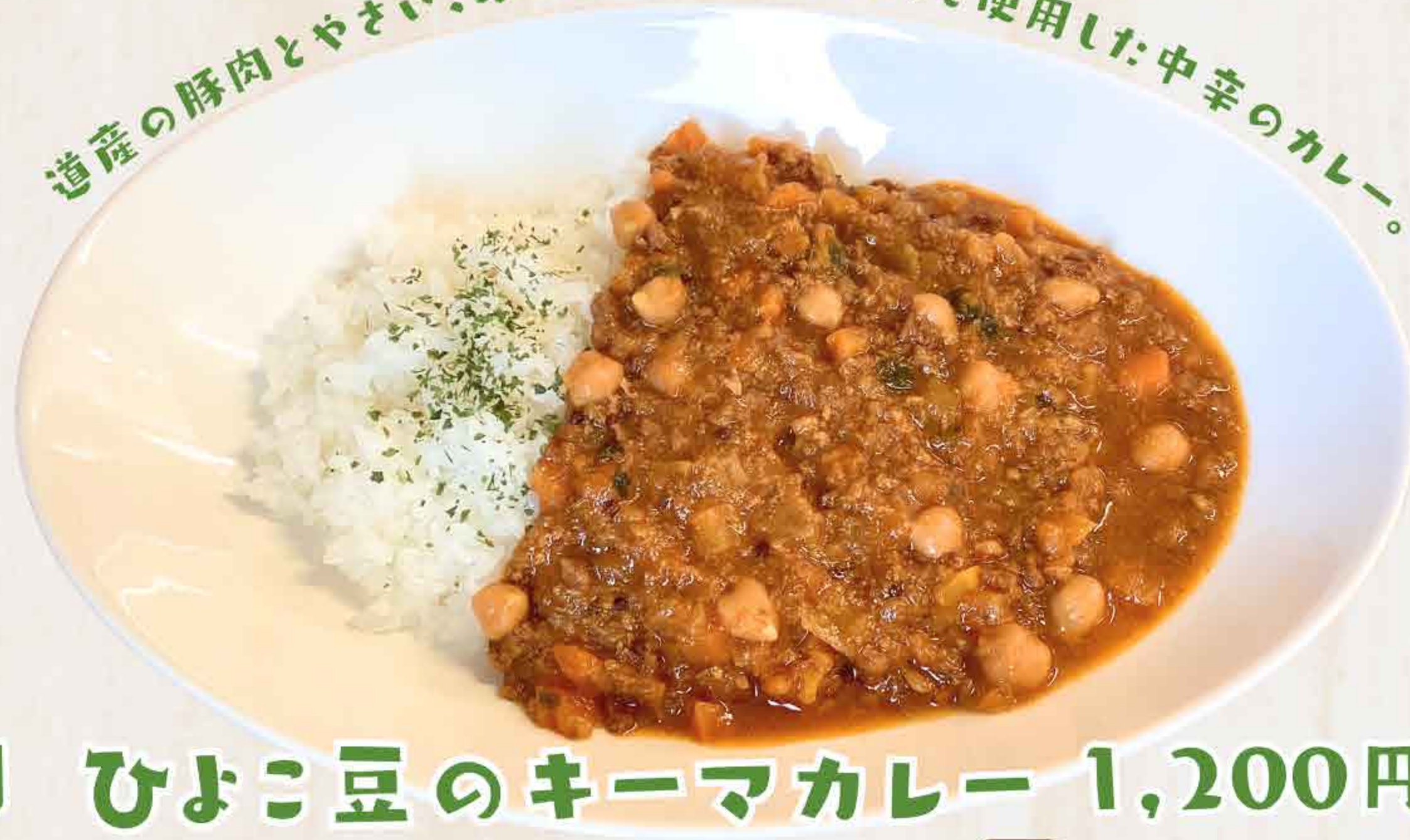
ひよこ豆のキーマカレー 1,200円 Chickpea Keema Curry