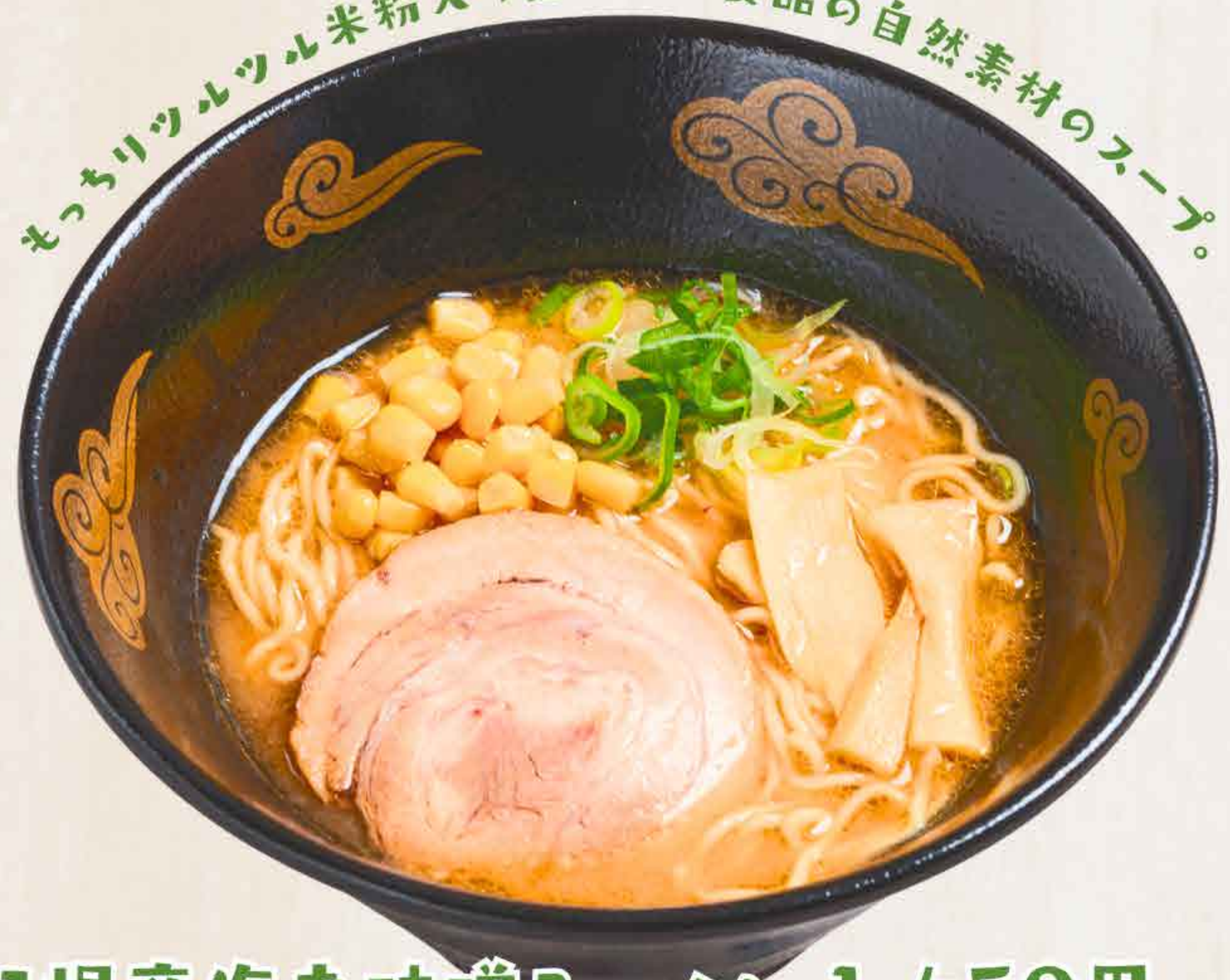
羽幌産海老味噌ラーメン 1,450円 Haboro Shrimp Miso Ramen