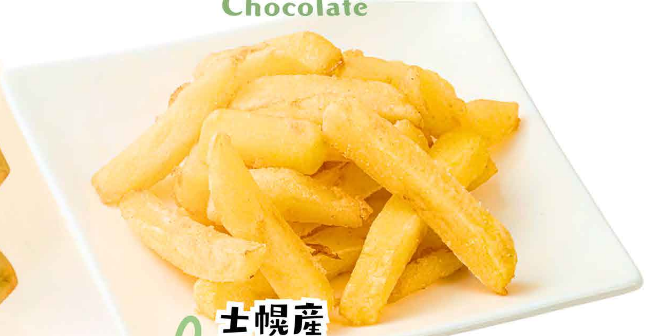
士幌産 フライドポテト 500円 Fried Poteto