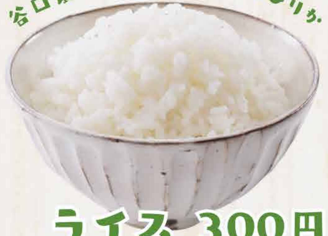
ライス 300円 Rice