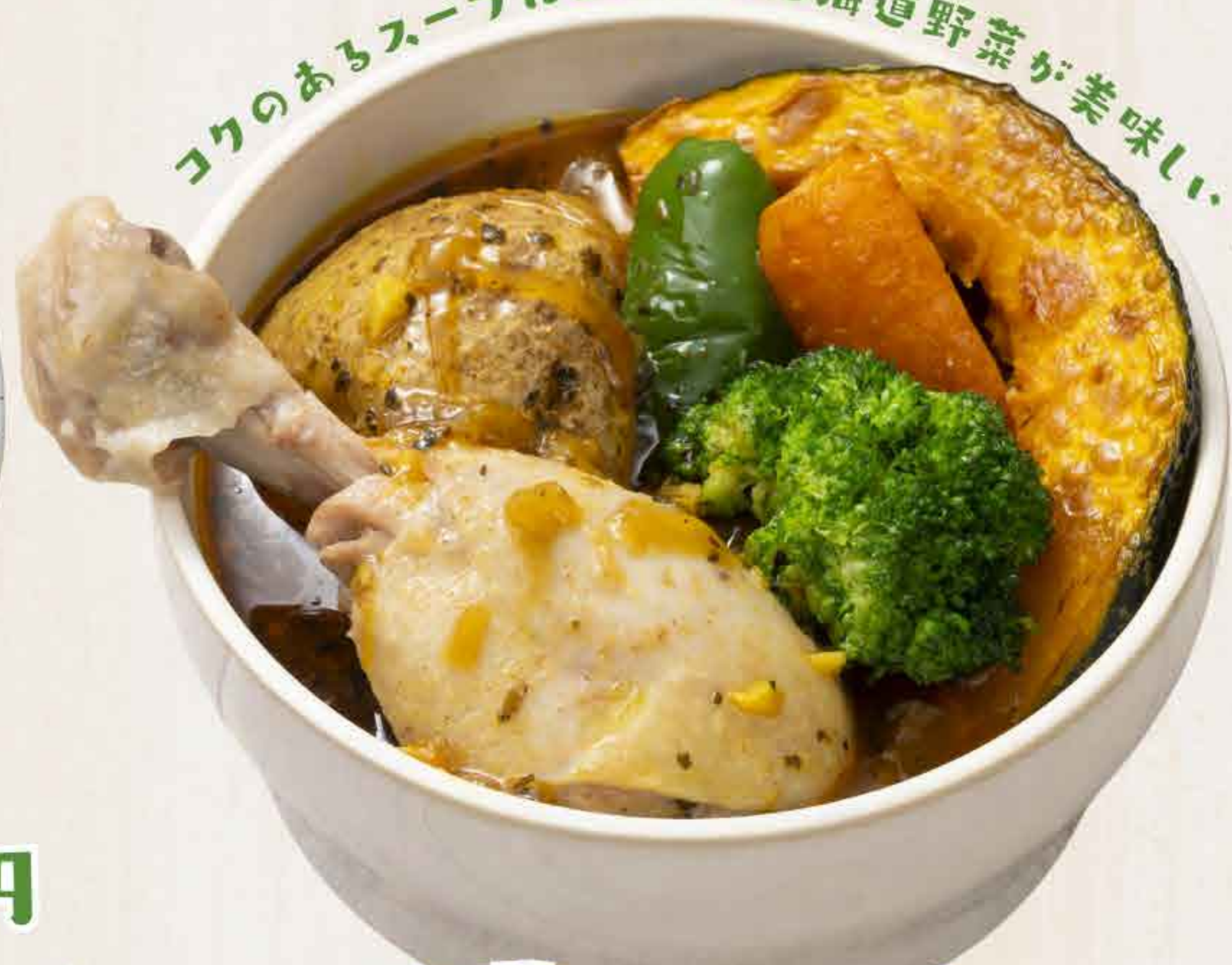
チキンと野菜のスープカレー 900円 Soup Curry with Chicken and Vegetables