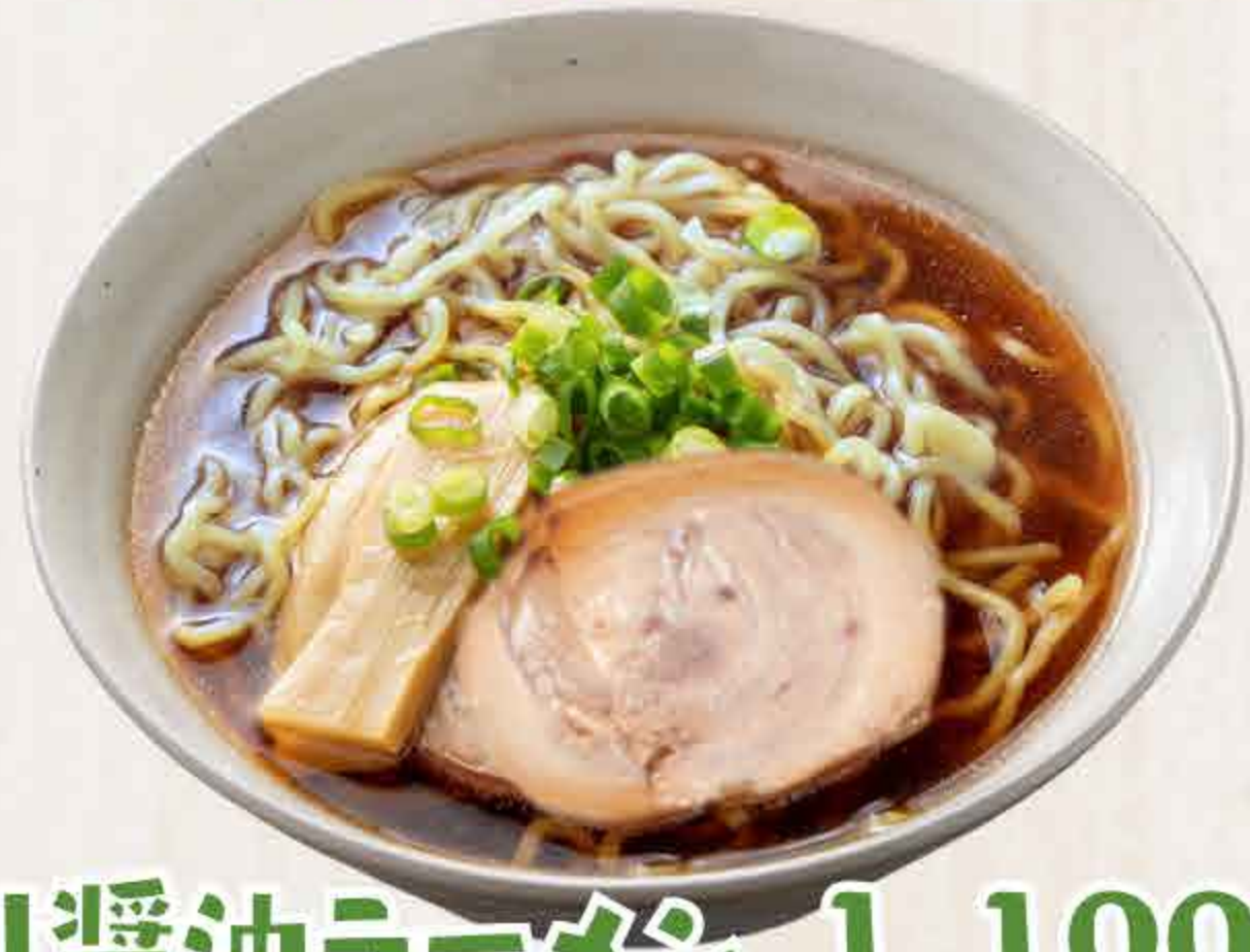
旭川醤油ラーメン 1,100円 Asahikawa Soy-sauce Ramen