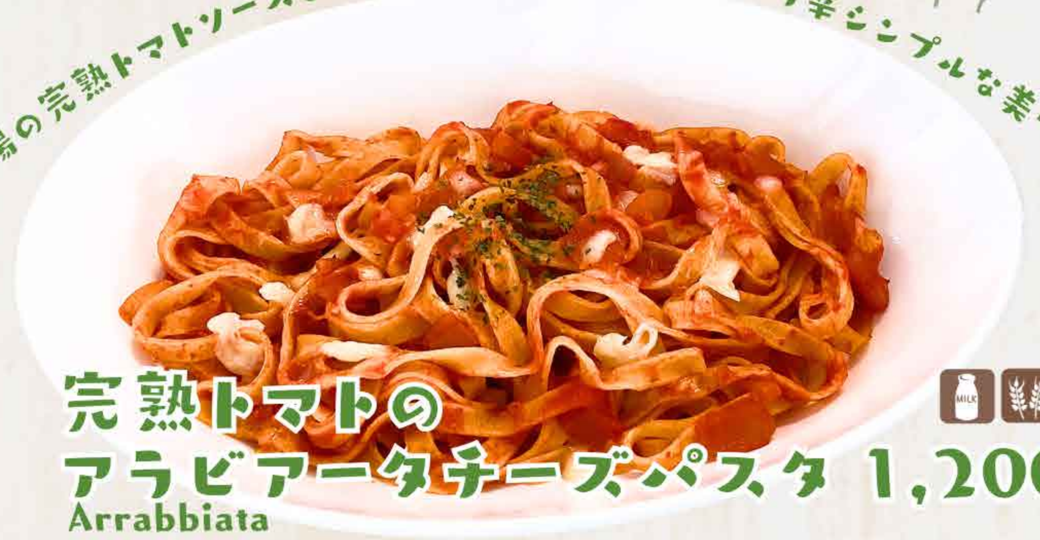
完熟トマトの アラビアータチーズパスタ 1,200円 Arrabbiata