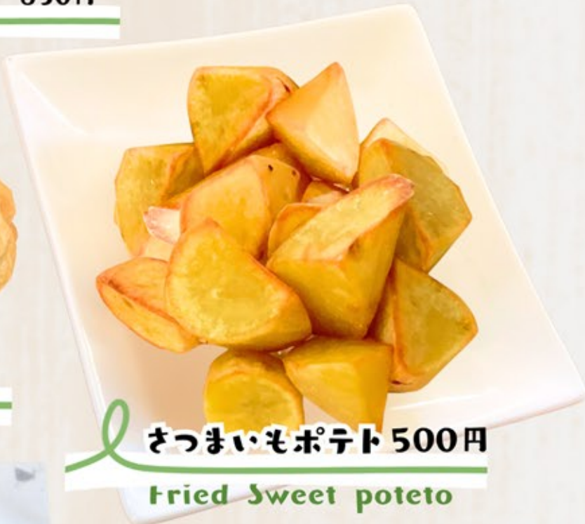
さつまいもポテト Fried Sweet poteto 500円