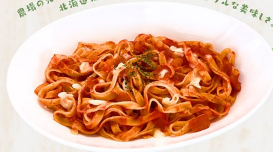
完熟トマトの アラビアータチーズパスタ Arrabbiata