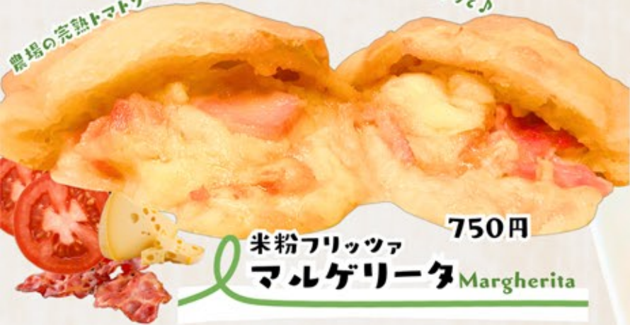
米粉フリッツァ マルゲリータ Margherita 750円