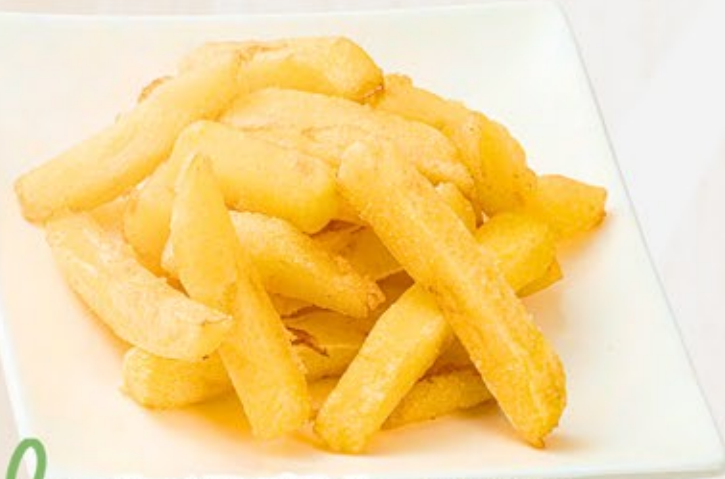
フライドポテト Fried Poteto 500円