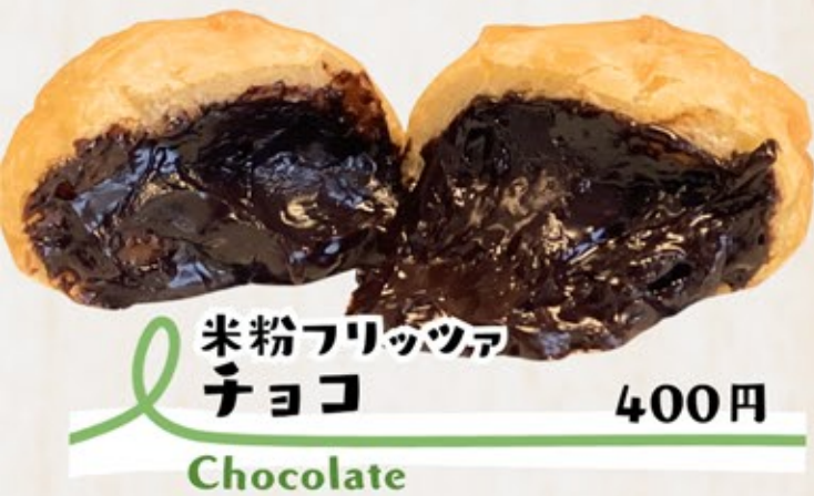
米粉フリッツァ チョコ Chocolate 400円