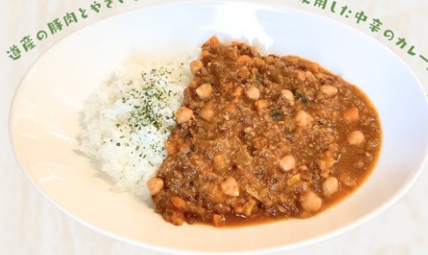
ひよこ豆のキーマカレー Chickpea Keema Curry