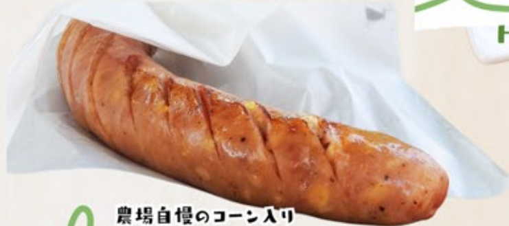
農場自慢のコーン入り コーンフランク Corn Frank 600円