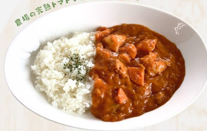
農場の完熟トマトカレー Tomato Curry