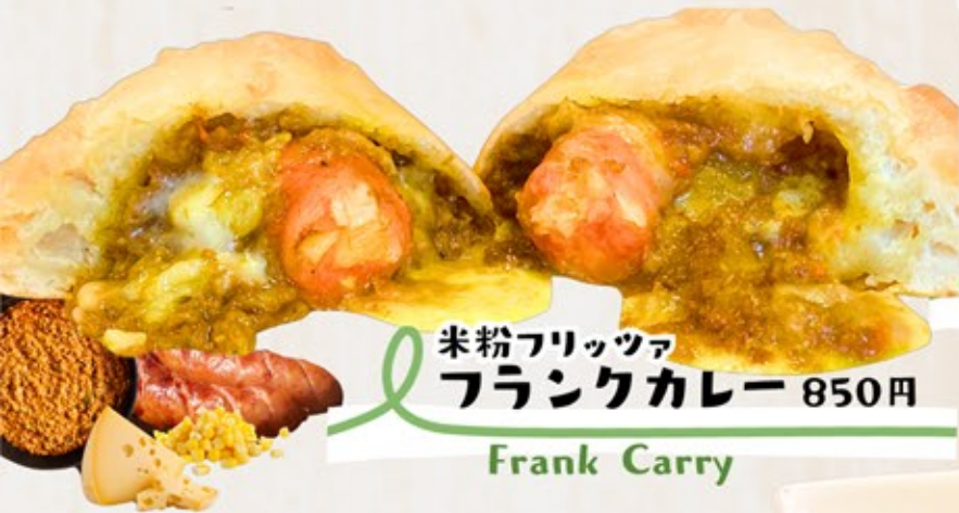
米粉フリッツァ フランクカレー Frank Curry 850円